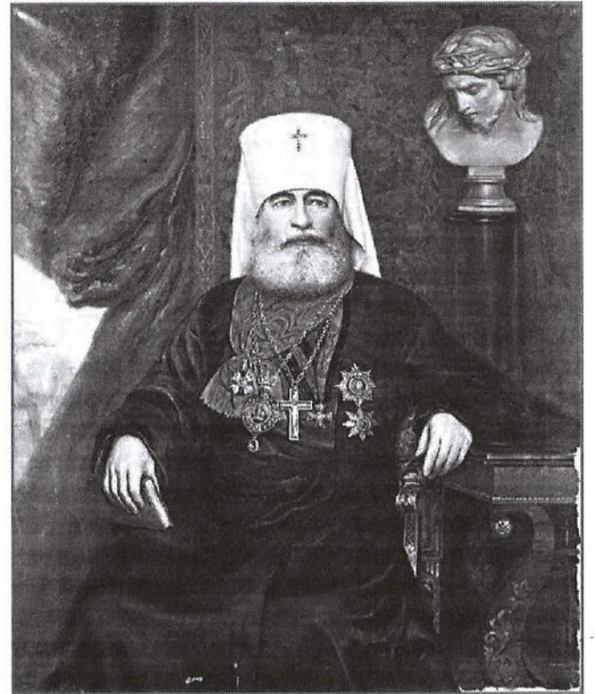
Митрополит Антоний (Вадковский). Портрет работы К. Карелина, 1911.

Собирая экспонаты, Валентина Фёдоровна попутно сумела выяснить, почему деревня носит название Монастырьки. До прихода в эти края шведов в 20-х годах XVII века здесь действительно стоял маленький монастырь Елисева пустынь. Его местонахождение было определено по найденным в этой местности предметам монастырского быта. Нашли даже место, где была келья.